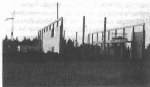
Opførelsen af bygningerne, der skal rumme Dan- marks Flyvemuseum ved lufthavnen i Billund, går planmæssigt. Billederne viser faser i byggeriet, som det tog sig ud en solskinsdag i oktober.

Man fortsætter så ud på den store balkon langs vestfacaden, under den tilsvarende i 6 m- niveauet. Her behandles tre temaer: